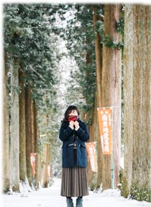
眼目山立山寺 トガ並木 (森林セラピー眼目エリア)