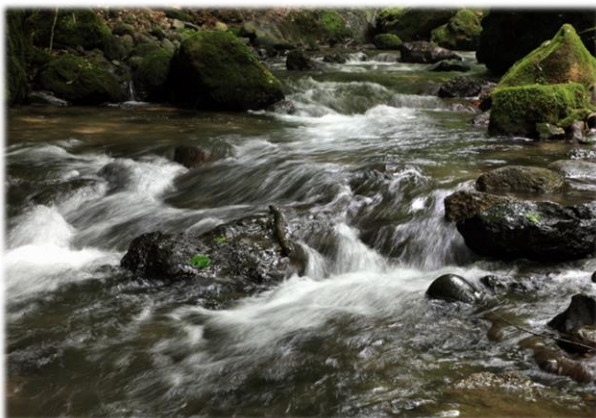
千巖溪 (森林セラピー大岩エリア)