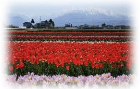
入善（にゅうぜん）町